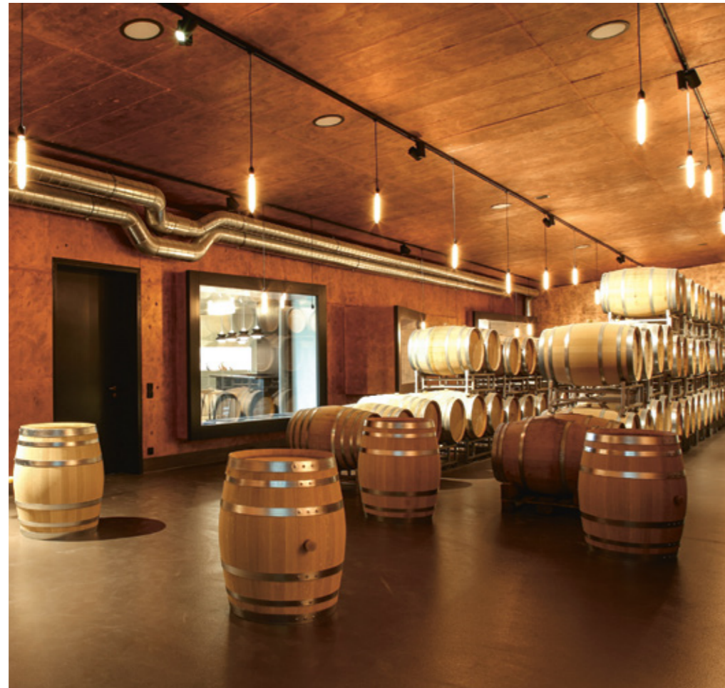
Neftenbach im Zürcher Weinland: die in Barriques reifenden, noblen Weine im blitzsauberen Saxer-Keller, der über dem Dorf mitten im Weinberg liegt.