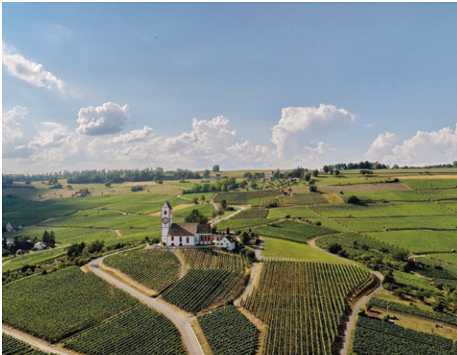
Hallau im Schaffhauser Blauburgunderland: Weinberge so weit das Auge reicht, im Mittelpunkt das Wahrzeichen des Weinbaudorfes, die Bergkirche St. Moritz.

Haselnüsse. Eleganter, feinfruchtiger Gaumen, frische, süsse Frucht, feines Tannin, duftige Aromatik, schlanke Struktur, frischer Abgang. 17/20 trinken –2038